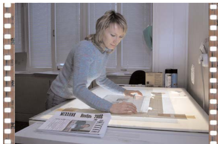
Подготовка к печати. Сложная и ответственная работа. Семь раз отмерь, один раз отрежь!