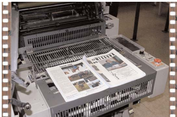
Хороша ложка к обеду, а свежий «Механик» – к концу месяца