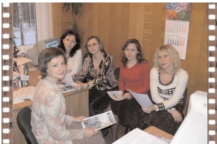
Макет «Механика» готов. Теперь его надо проверить на орфографию и пунктуацию