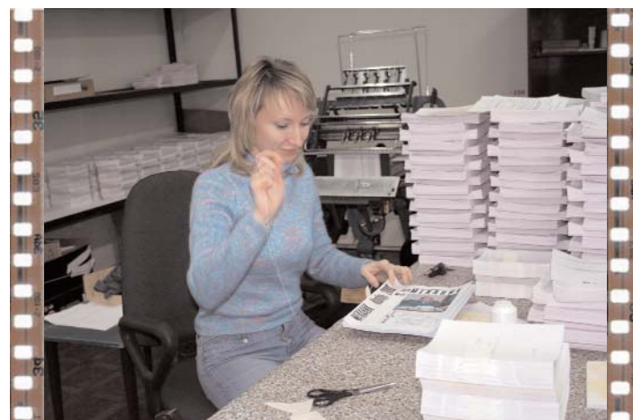
Техника имеет свойство ломаться. Тогда приходится братья за нитку и иголку