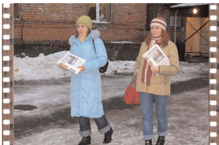
В ИжГТУ Печкина нет. Зато есть добровольные помощники