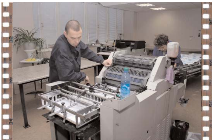
Настройка печатного станка. Все шестеренки смазаны. Болты подкручены. Скоро начнем!