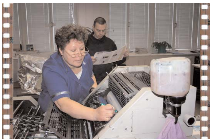
Последняя доводка. Последняя поправка. Краска залита. Лед тронулся, господа присяжные заседатели