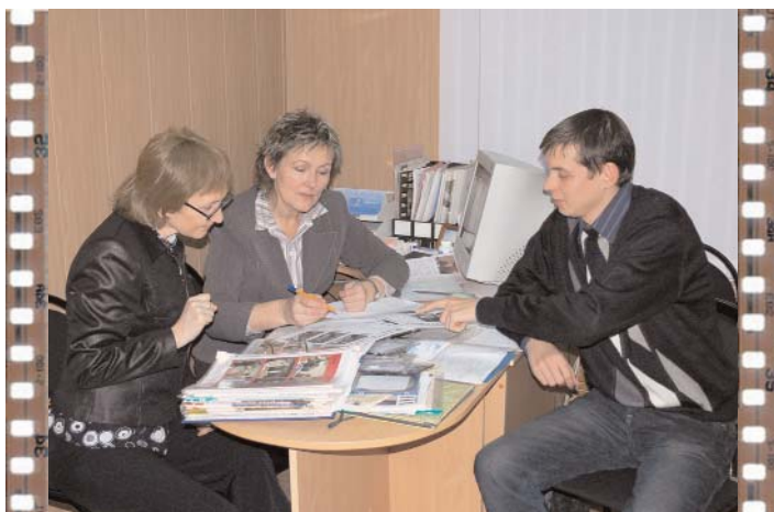
«Совет в Филях». Впереди много работы. Первые указания редактора