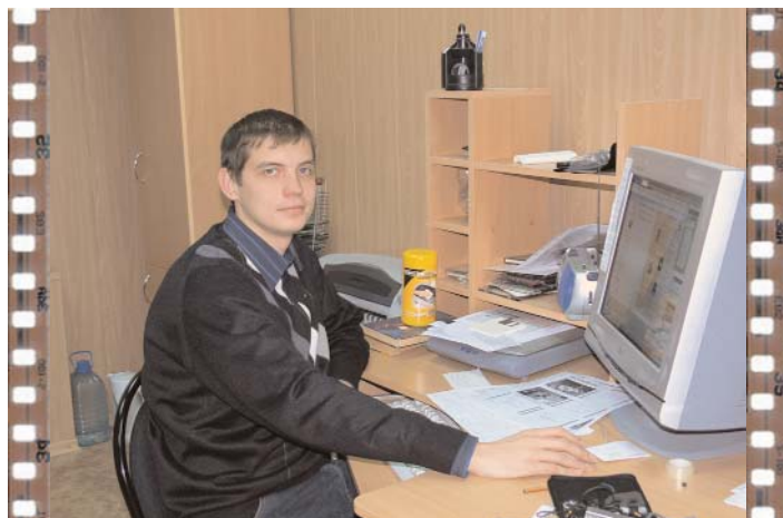
Материалы собраны. Пришла очередь верстальщика. Начинается электронное рождение газеты