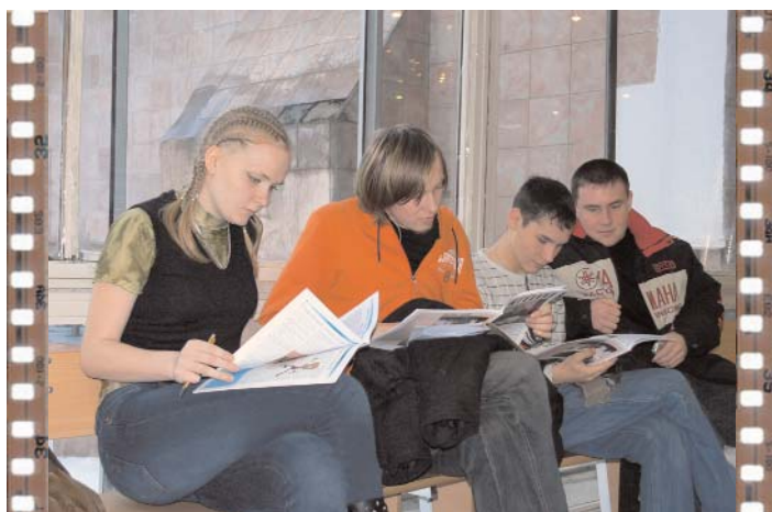
А это те самые читатели, для которых все так старались