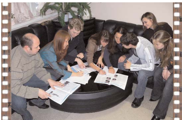
Пресс-клуб взялся за дело. Держись, Познер, растет твоя смена!